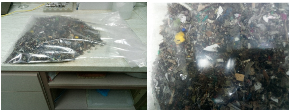
Slika 2. Uzorak sitne frakcije spremljen u plastičnoj vreći u laboratoriju

Vizualnim pregledom, ustanovljeno je da se sitna frakcija sastoji pretežito od plastike (> 90%), što su i potvrdili u postrojenju C.I.O.S. MBO Varaždin. S obzirom na trenutne potrebe tržišta i proizvod koji tvrtka C.I.O.S. MBO Varaždin želi plasirati na tržište (SRF- gorivo iz otpada) ulazni sastav otpada koji dolazi na obradu u postrojenje je plastika koja se odvojeno prikuplja u kućanstvima. Vrijeme prilikom uzimanja uzorka je bilo prohladno, poluoblačno.